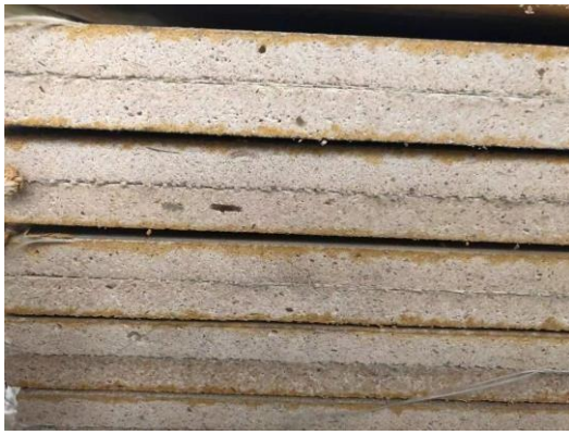
Gulvet er isolert.