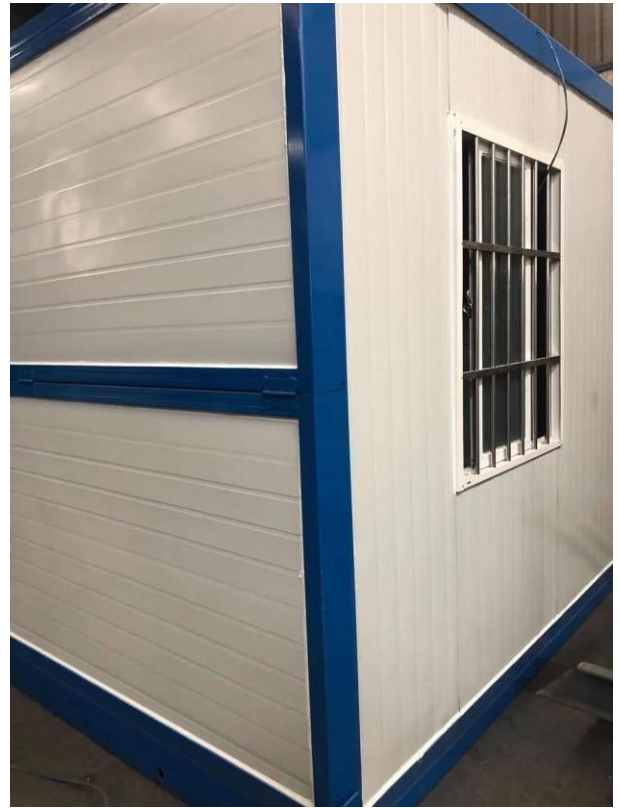
Stålstruktur i hjørner, gulv og vegger, Q235 galvanisert